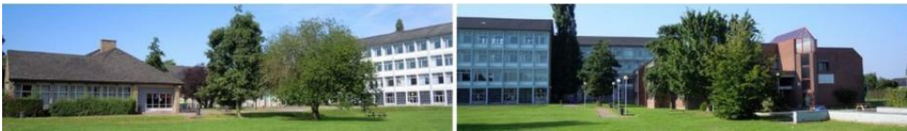
Ecole secondaire, rue Albert Croy 3 à Rixensart