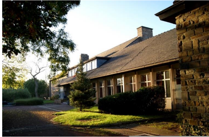
Ecole fondamentale, rue Albert Croy 3 à Rixensart comprenant une implantation sise chaussée de Rixensart, 9 à 1380 Lasne

L'Athénée Royal de Rixensart fut créé en 1955 sur 3 hectares dans le but premier de doter la commune d'un enseignement fondamental. Au fil du temps, il s'est enrichi de nouveaux bâtiments pour accueillir les élèves du secondaire, d'un restaurant scolaire et de halls de sport.